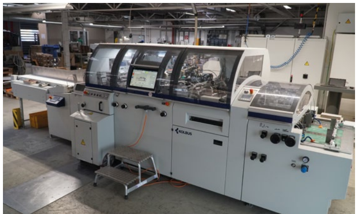
Die universell einsetzbare Deckenmaschine DA 370 repräsentiert höchste Kolbus-Ingenieurskunst. Bei der Feindruckerei Gutenberg Beuys entstehen darauf sehr hochwertige Bücher, wie zum Beispiel Kunstbände.