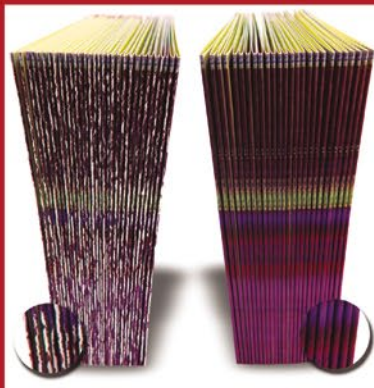
ohne TRI-CREASER mit